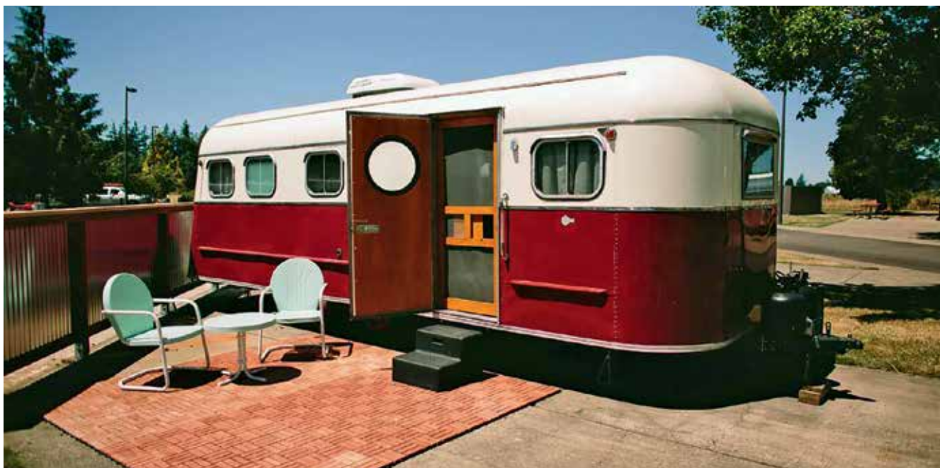
Рисунок 2. Номер в глэмпинге «The Vintages Trailer Resort» (штат Орегон, США)

мер комплекс «Айдар» в Узбекистане, база «Гунны» в Казахстане. Есть аналогичные средства размещения и в России, например детский юрточный лагерь «Солнечное кочевье» на Байкале, юрточный кемпинг «Торехоль» в Республике Тыва и др.