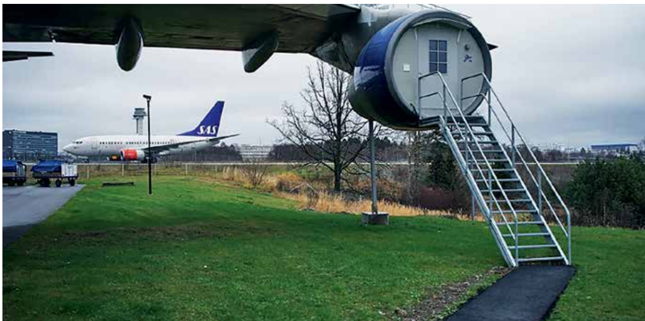
Рисунок 3. Номер в глэмпинге «Jumbo Stay» (Стокгольм, Швеция)

Типы / вигвамы. Данный вид глэмпингов представлен как отдельными объектами (например, роскошный вигвам «Pop Up Tipi Retreat» в штате Калифорния, США), так и лагерями, состоящими из конструкций, стилизованных под традиционные жилища коренных народов, например «Tipi Village Retreat» в штате Орегон, США.