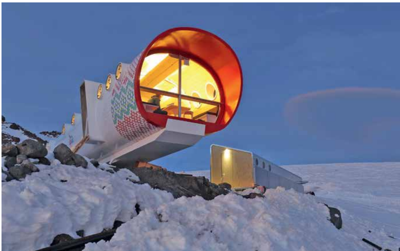
Рисунок 4. Глэмпинг «LeapRus» (Кабардино-Балкарская Республика, Россия)

Палатки. Данный тип размещения включает палаточные городки, которые состоят преимущественно из быстровозводимых конструкций. Обычно палатки располагаются на территориях национальных парков одним лагерем либо дислоцируются несколькими группами объектов в зависимости от категории номерного фонда: стандарт, люкс и семейные номера. Каждое строение меблировано, может включать средства отопления, кондиционеры, телевидение и доступ в Интернет. Питание осуществляется в ресторане по системам «проживание и завтрак» и «все включено». Большинство средств размещения открыты круглогодично, но встречаются и сезонные. Например, глэмпинг «Sequoia High Sierra Camp» (национальный парк «Секвойя», штат Калифорния, США) представляет собой лагерь из 32 палаток. Каждая палатка обставлена мебелью ручной работы: кроватями в зоне отдыха, столиками и стульями в гостиной зоне. В стоимость проживания входит трехразовое питание в ресторане. За дополнительную плату организуются экскурсии по национальному парку.