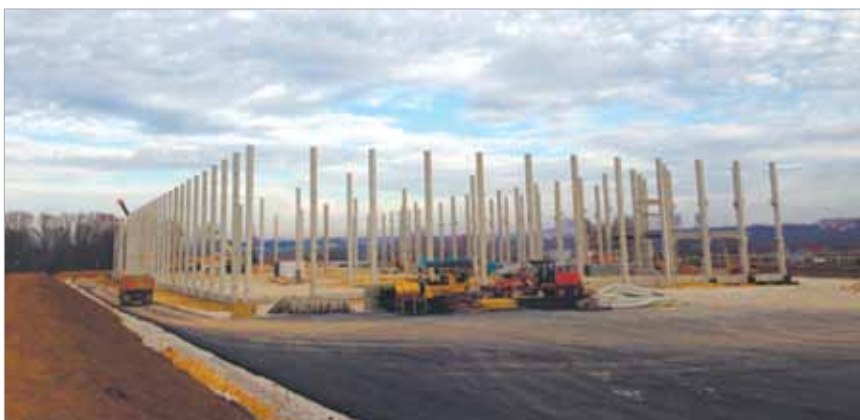
↑ Возведение каркаса складского комплекса

Компания DockLand приступила к строительству современного логистического центра на собственном земельном участке в 3 км от федеральной трассы М2, в 170 км от МКАД, в Тульской области, вблизи деревни Нижнее Елькино.